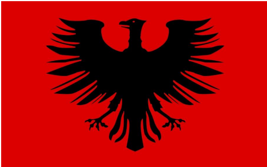
El Partido Socialista del Reich: Sozialistische Reichspartei Deutschlands, abreviado SRP.

El Partido Socialista del Reich (SRP) se fundó en 1949 y pronto tuvo dos miembros en el Bundestag, que desertaron de otros partidos cuando se formó el SRP. Otto Ernst Remer no solo fue el líder adjunto, sino también el militante más enérgico, recibiendo respuestas entusiastas a su condena de la imposición democrática estadounidense y elogios por los logros del nacionalsocialismo. [25] Remer pronto fue prohibido en Schleswig-Holstein y Renania del Norte-Westfalia, donde SRP era más popular. Las autoridades de ocupación estadounidenses no solo notaron el estilo "nazi" del SRP, sino también su oposición a una alianza occidental y la defensa de una Europa unida como una tercera fuerza, dirigida por una Alemania reunificada. La SRP atrajo a 10.000 miembros y creó organizaciones para mujeres, jóvenes y sindicalistas.