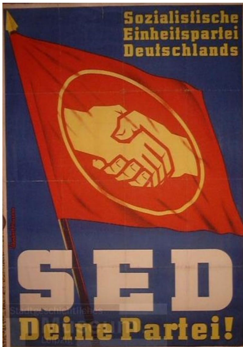
Propaganda comunista del Partido de Unidad Socialista, Sozialistische Einheitspartei Deutschlands: SED.

El punto de vista de Stalin era diferente. ¿Sería posible organizar a los "fascistas" en la zona soviética bajo un nombre diferente? Señaló a los líderes del SED que su política de "exterminar a los fascistas" no era diferente de la de EE. UU. y afirmó: " Tal vez debería agregar este curso [de organizar un partido nacionalista] para no empujar a todos los ex nazis a el campo enemigo? " [1].