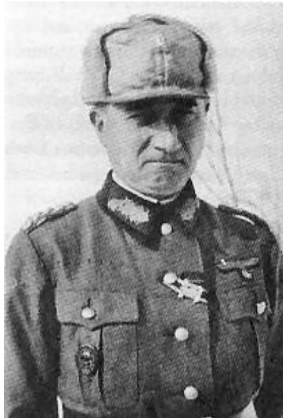
Arno von Lenski.

1950. Trabajó con la administración municipal. Berlín, se unió al KVP y se convirtió en un gran general en el Ejército Popular Nacional. En 1952, se desempeñó como miembro de Volkskammer, para el NDPD.