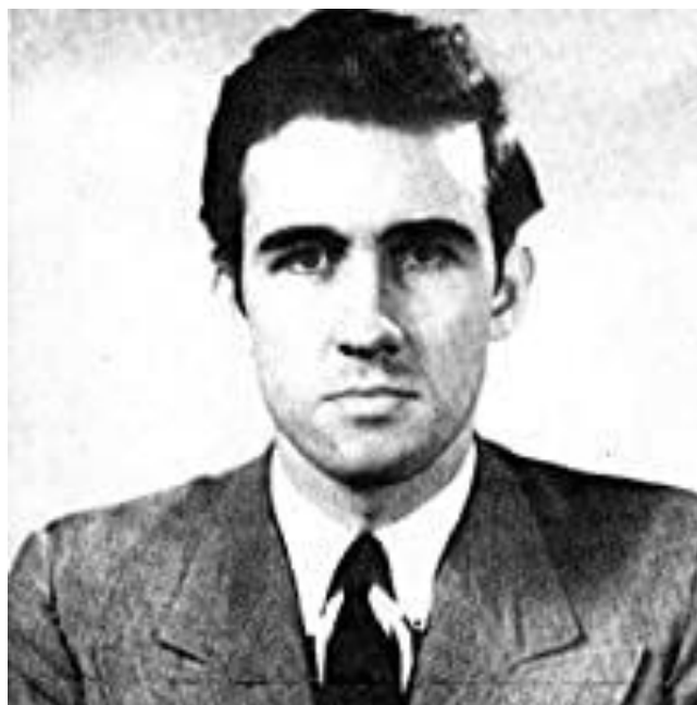
En la imagen Francis Parker Yockey.

En este momento, el filósofo y activista estadounidense Francis Parker Yockey, al apelar a la liberación y unidad de Europa, al igual que Remer, estuvo dispuesto a colaborar con la URSS para purgar el "suelo sagrado" de Europa de la ocupación estadounidense, a la que consideraba ejecutora de la "distorsión cultural" judía. Yockey, quien hasta su arresto en los EE.UU. en 1960, había eludido la inteligencia militar, la Interpol y el FBI, viajó por el mundo organizando un renacimiento "fascista", del cual era asesor el SRP.